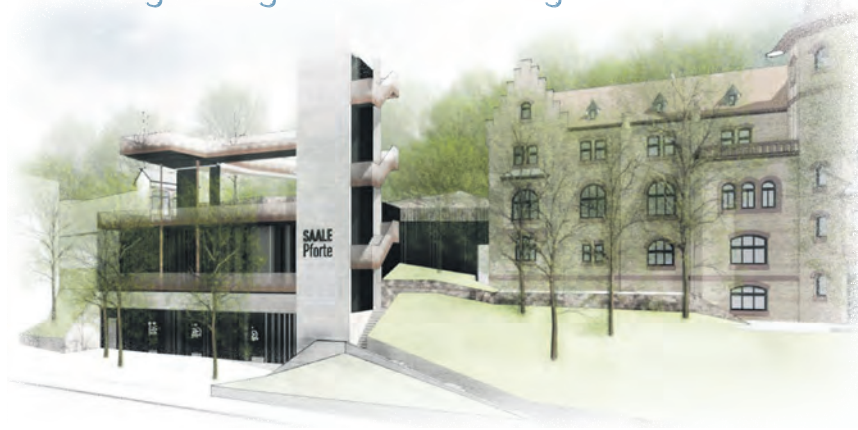
So könnte der dreigeschossige Treppenturm in der Seebener Straße am Hintereingang zum Zoo aussehen. Visualisierung: HPP Architekten GmbH

So ist neben der Errichtung der „Saalepforte“ auch eine Ergänzung beziehungsweise Verbesserung der Trassenführung in Abschnitten des Saale- sowie des Elsterradwanderweges geplant. Knapp 5,3 Millionen Euro will die Stadt investieren, unter anderem am Saaleradweg in die Herstellung eines durchgehenden, asphaltierten Radschutzstreifens in der Kaiserslauterer