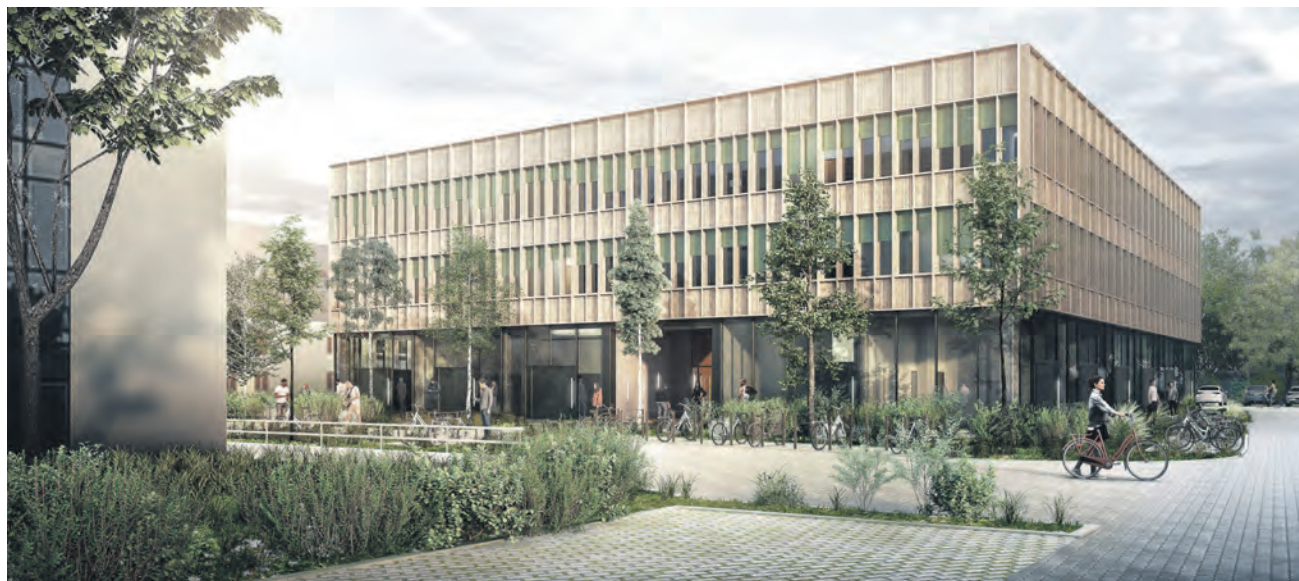
Architektur-Entwurf für den Neubau des Innovation Hubs